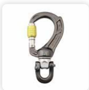
› A64x Director Swivel Boss D - Alle Tortypen