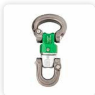
› SW470 Nexus Schwenkbogen zu D