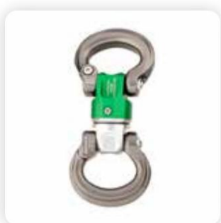
› SW490 Nexus Swivel Bow to Bow