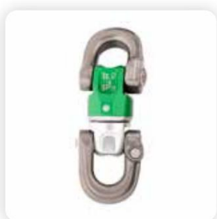
› SW480 Nexus Swivel D nach D