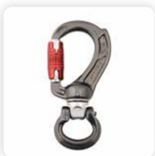
› A64x Director Swivel Boss Bow - Alle Tortypen