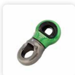
› SW400 Mini-Drehgelenk

Dieser Rückruf betrifft alle zum Zeitpunkt dieses Rückrufs im Umlauf befindlichen Einheiten einschließlich aller Farbvarianten (nicht unten aufgeführt).