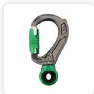
› A63x Director Swivel Auge - Alle Gate-Typen